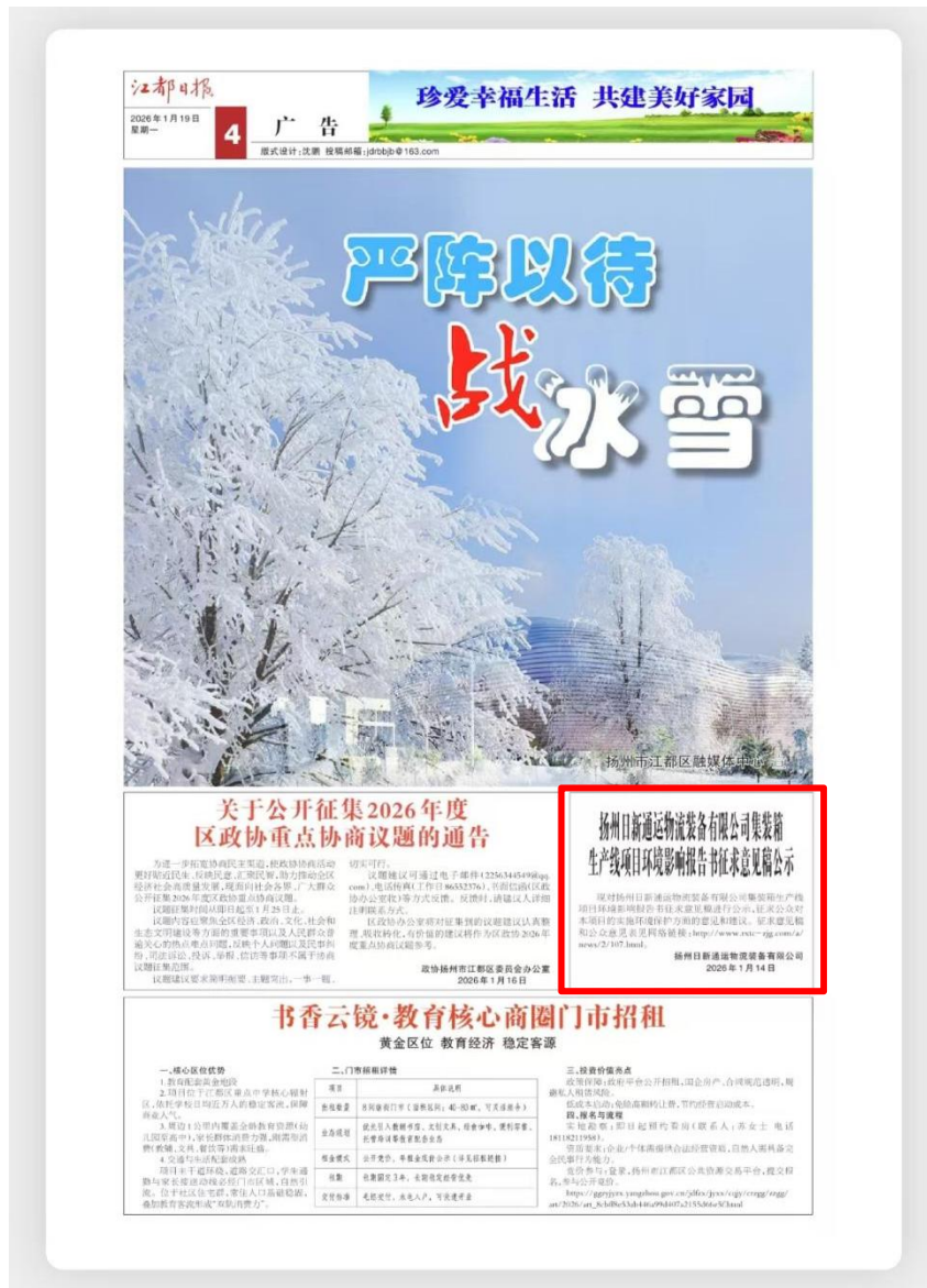
图 3-3 第二次报纸公示